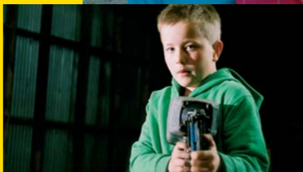
Careful with that power tool by Jason Stutter