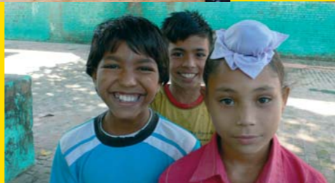
Wagah by Supriyo Sen & Najaf Bilgrami