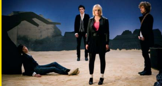
Les Astres Noirs by Yann Gonzalez