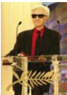
De gauche à droite : Isabelle Huppert, Michael Haneke, Charlotte Gainsbourg, Jacques Audiard, Shu Qi, Penelope Cruz, Elia Suleiman, Alain Resnais, Abbie Cornish & Jane Campion, Martin Scorsese, Monica Bellucci & Sophie Marceau, Quentin Tarantino & Mélanie Laurent.